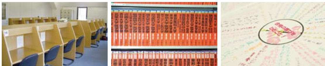
※通常の冬期授業は外部の方には公開しておりません。

自習室は朝8時30分から夜10時まで、自由にお使いいただけます。また、どの科目の質問もプロフェッショナル講師やチューターにいつでも、どんどんして下さい。(日曜日のみ自習室は夜7時までとなります)